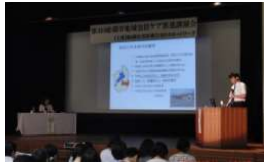
【地域包括ケア推進講演会】